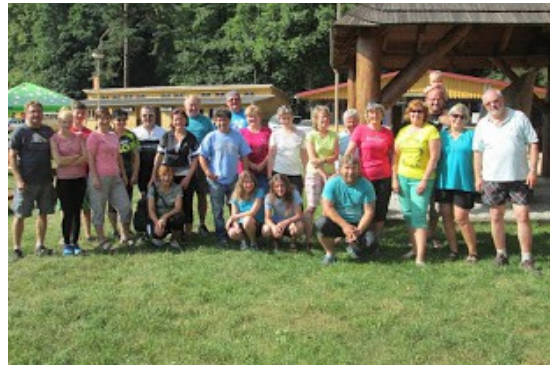
Černý Potok 2015

Další informace o kempu a okolí najdete zde: www.taborcernypotok.cz